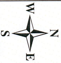
Схема расположения элемента планировочной структуры для строительства объекта АО "РИТЭК": «Обустройство скважины № 110 Комаринского месторождения» в границах сельского поселения Большая Глушица муниципального района Большеглушицкий Самарской области