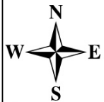
Схема расположения элемента планировочной структуры для строительства объекта АО "РИТЭК": «Обустройство скважины № 25 Токолянского месторождения» в границах сельского поселения Александровка муниципального района Большеглушицкий Самарской области