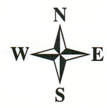
Схема использования территории в период подготовки планировки территории для строительства объекта АО "РИТЭК" «Обустройство скважины № 454 Крюковского месторождения» в границах сельского поселения Малая Глушица муниципального района Большеглушицкий Самарской области