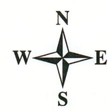
Схема границ зон с особыми условиями использования территории для строительства объекта АО "РИТЭК" «Обустройство скважины № 454 Крюковского месторождения» в границах сельского поселения Малая Глушица муниципального района Большеглушицкий Самарской области