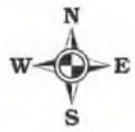
Схема организации улично-дорожной сети и схема движения транспорта на соответствующей территории для строительства объекта ОАО "РИТЭК": "Обустройство скважин №№ 45,46,47,48,49,50 Чечерского месторождения" на территории Большеглушицкого района, в границах сельского поселения Александровка