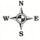
Схема организации улично-дорожной сети и схема движения транспорта на соответствующей территории для строительства объекта ОАО "РИТЭК": "Обустройство скважины № 102 Восточно-Фурмановского месторождения" на территории Большеглушицкого района, в границах сельского поселения Малая Глушица