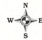
Схема использования территории в период подготовки проекта планировки территории для строительства объекта ОАО "РИТЭК": "Обустройство скважины № 78 Мамуринского месторождения" на территории Большеглушицкого района, в границах сельского поселения Малая Глушица