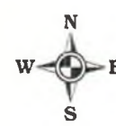
Схема вертикальной планировки и инженерной подготовки территории для строительства объекта ОАО "РИТЭК": "Обустройство скважины № 78 Мамуринского месторождения" на территории Большеглушицкого района, в границах сельского поселения Малая Глушица